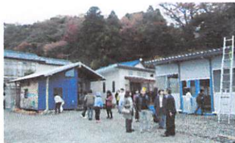
復興事務所(左)と建設中の仮設店舗↓

620世帯約2000人のまちが津波に襲われ、亡くなった方87人、全壊家屋430戸。震災の年の8月に「ふるさと豊間復興協議会」設立、秋から東京支援グループがお手伝い。協議会事務所の建設をワークショップで実施。以後今春まで計画検討、コミュニティ再建検討等のWS数十回。