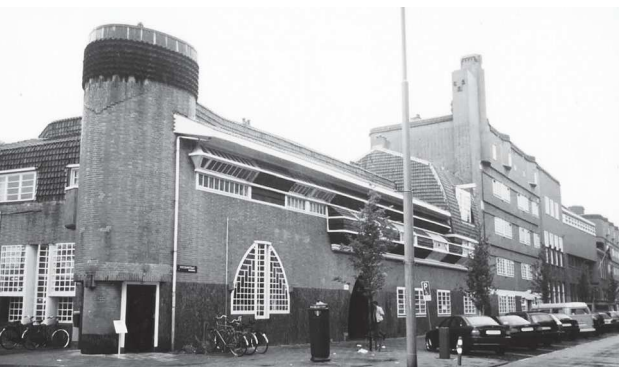
エイヘン・ハルト住棟北東面外観 左から郵便局、集合住宅、学校

ブリッツ・ジードルング 1925年～1930年 ブルーノ・タウト/マルティン・ワーグナー