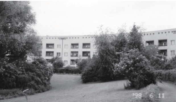
ブリッツ・ジードルング 馬蹄形エリア中央部分と住棟